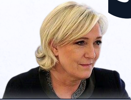
Marine Le Pen

Députée du Pas-de-Calais, ex présidente du EN